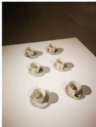
Instalación de Jorge Ivan Agudeio, medidas variables