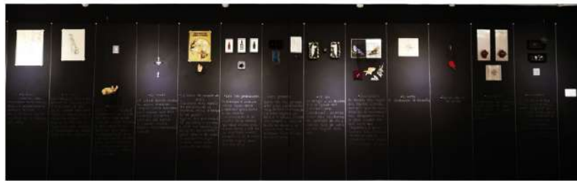
Instalación Jorge Gustavo Valencia. 700 x 240 cm