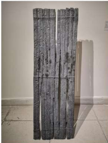
Obra Daniel Fernando Gómez. 80 x 35 cm. escultura en plomo