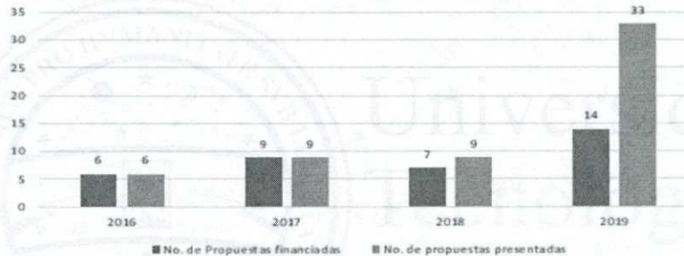
Histórico Convocatoria Extensión social