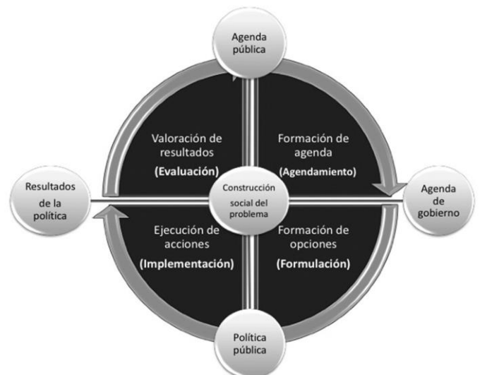
Figura 4. Ciclo de una política pública