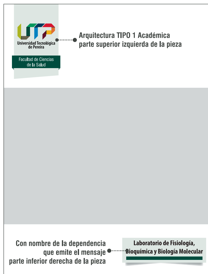
Ejemplo 2, ubicación Arquitectura TIPO 1 Académica, con nombre de la dependencia que emite el mensaje en la pieza gráfica.