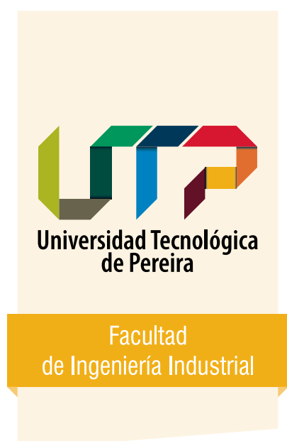
Arquitectura gráfica TIPO 1 - Académica Facultad de Ingeniería Industrial.