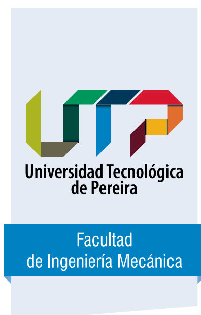
Arquitectura gráfica TIPO 1 - Académica Facultad de Ingeniería Mecánica.