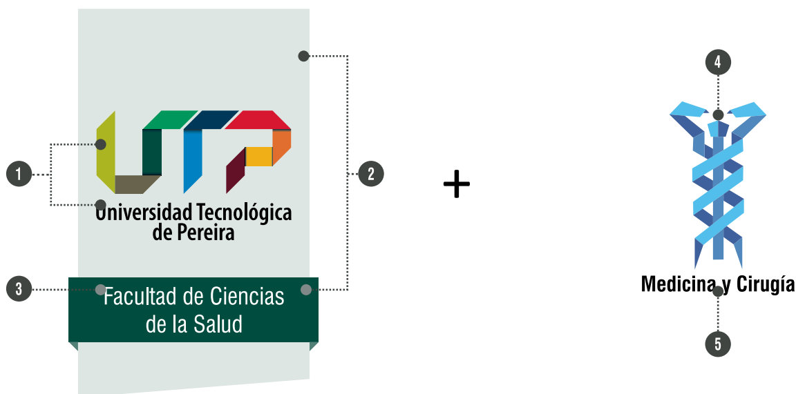
Ejemplo 1: Arquitectura Gráfica TIPO 1 Académica más ícono del Programa Académico de Pregrado.