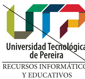
Con nombres adicionales de dependencias.

5. En general cualquier tipo de cambio que altere el Logo UTP distorsiona la imagen de la Universidad.