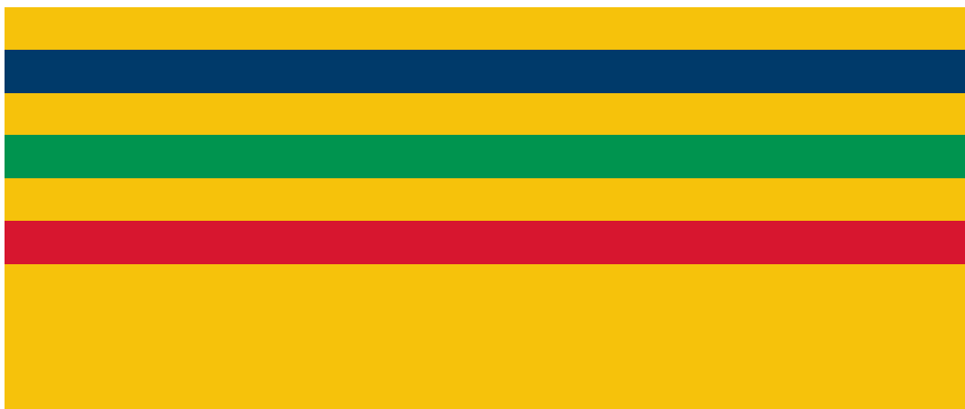
Bandera - Universidad Tecnológica de Pereira.