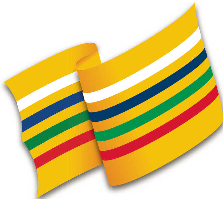
Bandera de la Universidad Tecnológica de Pereira.

Los colores establecidos en la Bandera hacen parte de la razón de ser y un quehacer diario que representa a toda la comunidad UTP. Sus significados son los siguientes: