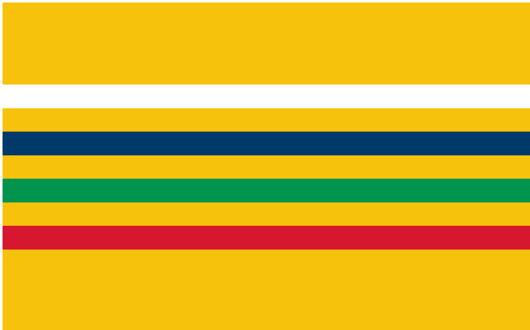
Ejemplo 2 - Bandera sin Escudo.