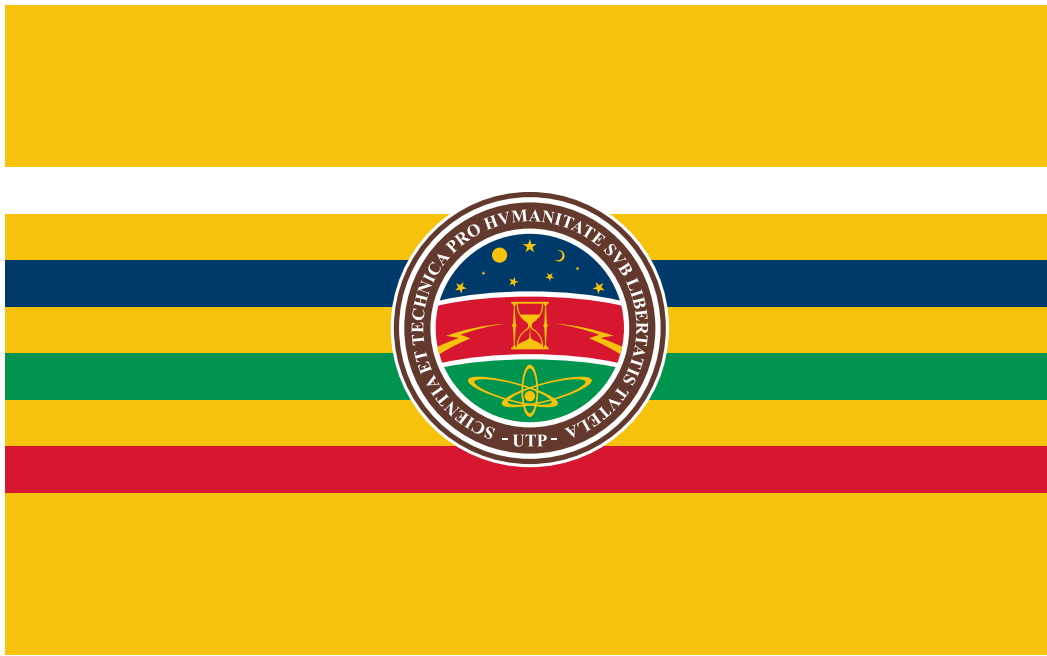
Ejemplo 1 - Bandera con Escudo.