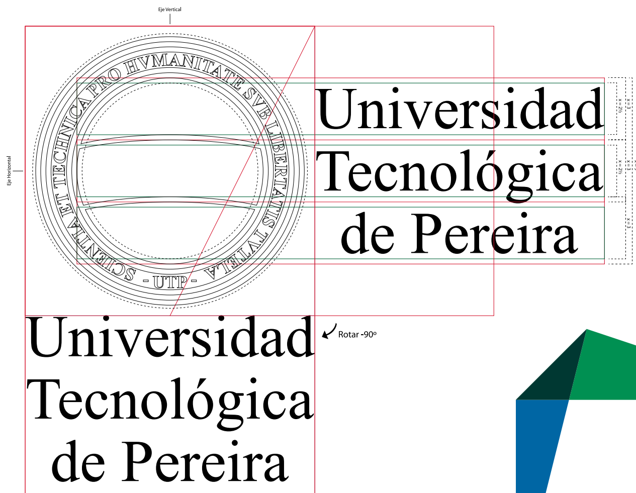
Nombre en el Escudo - Versión vertical y horizontal.

La construcción del nombre “ Universidad Tecnológica de Pereira ” se sustenta en el rectángulo áureo y la distribución respectiva se da en tres líneas justificadas al centro de la primera palabra. Se deben ubicar a partir del centro de cada una de las tres franjas principales (9.0 cm x 3.0 cm) respectivamente. Para la construcción vertical del nombre se debe desplazar rotando el rectángulo áureo horizontalmente 90° desde el vértice superior izquierdo. El tamaño de cada palabra del nombre debe ser de 81,2 puntos en la fuente tipográfica Times New Roman .