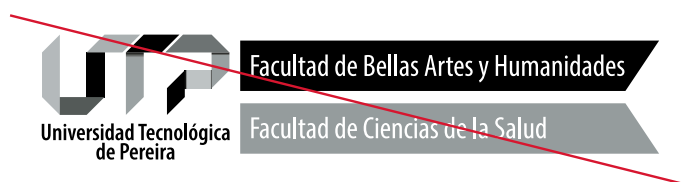
Uso incorrecto a escala de grises - Cobranding Interno.

Importante. Nunca utilizar la versión a escala de grises , se deben utilizar las versiones monocromáticas.