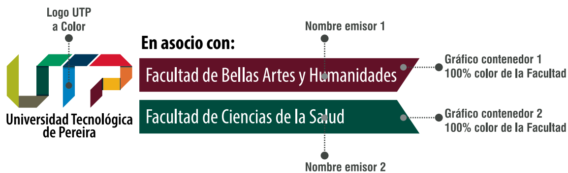
Colores del Cobranding Interno.

Se deben incluir los nombres de las dependencias involucradas justificados a la izquierda del gráfico contenedor y respetando su tipografía, estilo y ubicación.