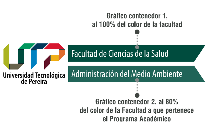
Ejemplo - Cobranding Interno entre una Facultad y un programa Académico de Pregrado.