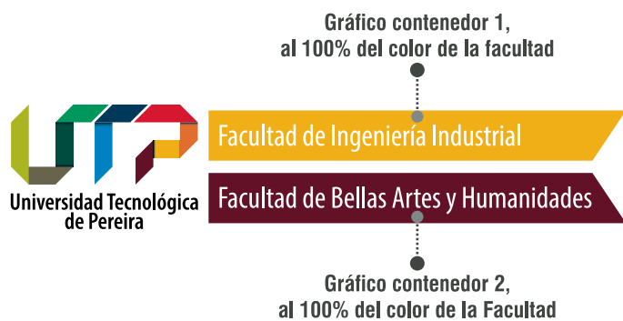
Ejemplo - Cobranding Interno entre dos Facultades.