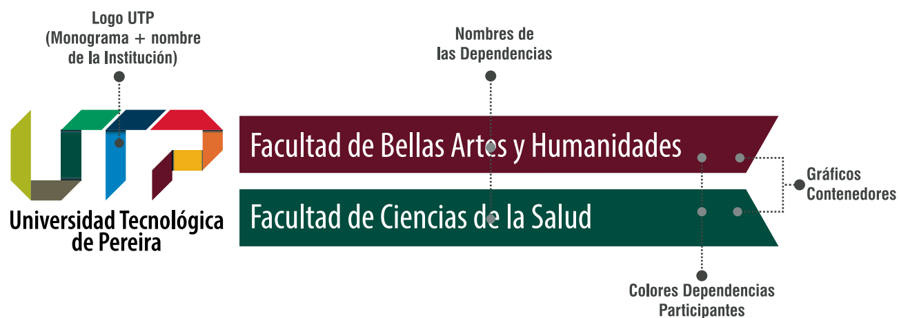
Planimetría base del Cobranding Interno.