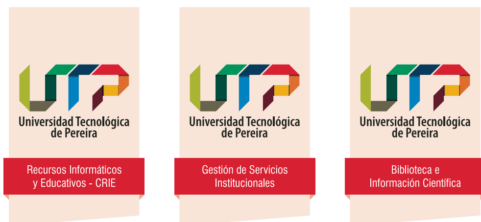
Ejemplos: Arquitectura Gráfica TIPO 3 - Servicios.