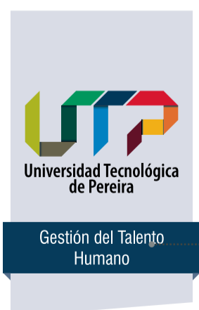
Variación en la Arquitectura TIPO 2 Administrativa con nombre de la Dependencia Principal.

Importante. La Arquitectura TIPO 2 identifica a todas las dependencias adscritas a la Rectoría o a una de las 4 Vicerrectorías de la Institución.