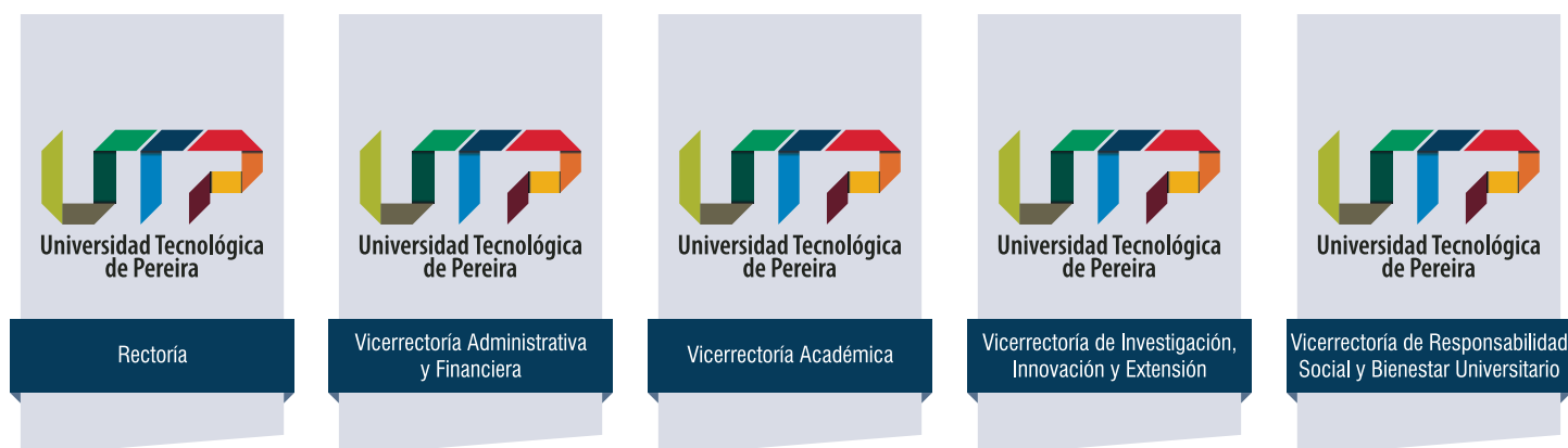
Ejemplos: Arquitectura Gráfica TIPO 2 - Administrativa Arquitectura Rectoría y Vicerrectorías.