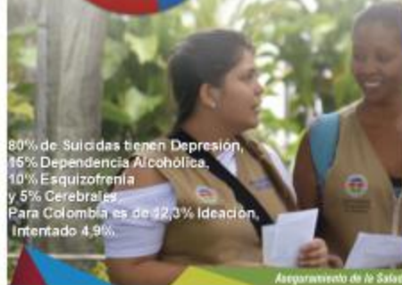
Aseguramiento de la Salud

80% de Suicidas tienen Depresión, 16% Dependencia Alcohólica, 10% Esquizofrenia y 5% Cerebrales. Para Colombia es de 12,3% Ideación, Intentado 4,9%.