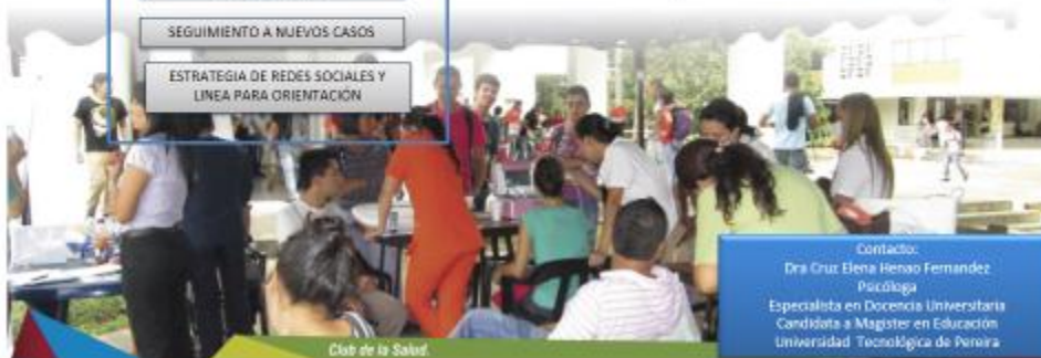
Club de Salud