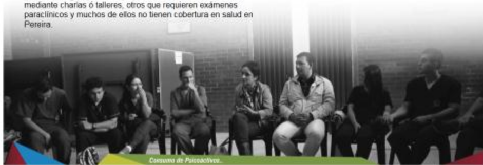
Colectivo de Psicodivulgo

En general los principales motivos de consulta fueron: Gingivitis crónica, trastorno de ansiedad generalizada, diarrea y gastroenteritis de presunto origen infeccioso, fobias sociales, episodio depresivo moderado, acné, Diarrea, Depresión, Fobias Sociales, Trastornos Alimentarios y Nutricionales, Infección de Vías Urinarias, Mareo y Desvanecimiento, Síncope, resfriado común y rinofaringitis.