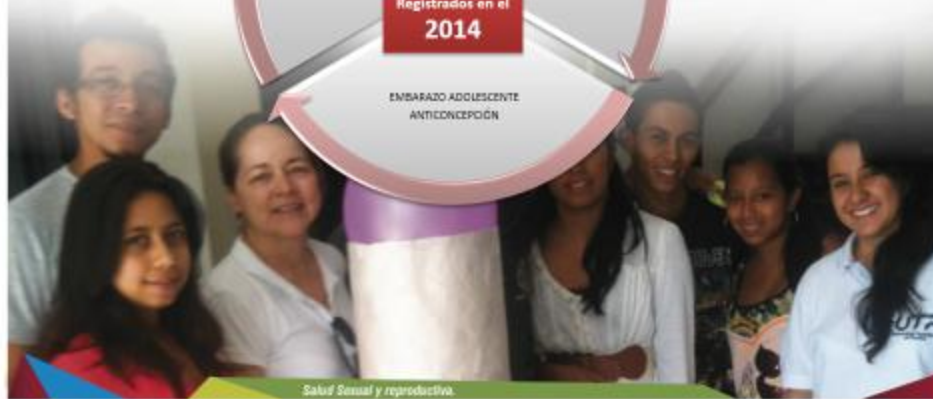
Salud Sexual y reproductiva.