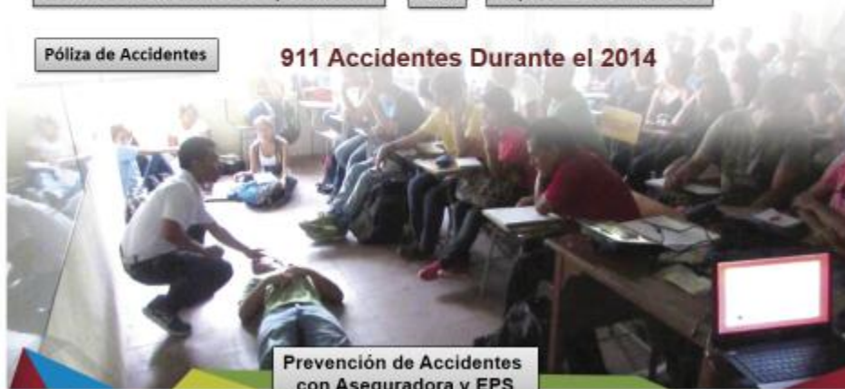
Prevención de Accidentes con Aseguradora y EPS