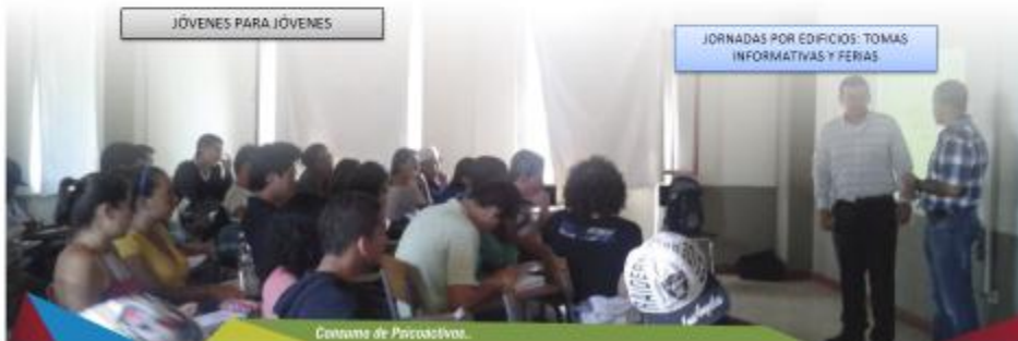
Consumo de Psicoactivos.

JORNADAS POR EDIFICIOS: TOMAS INFORMATIVAS Y FERIAS