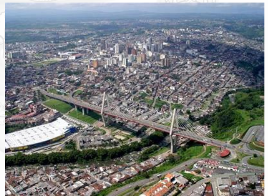
Panorámica ciudad de Pereira