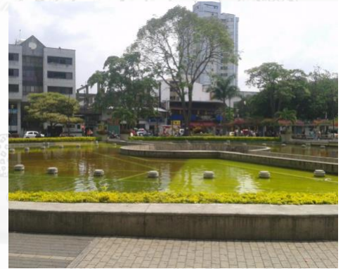
Parque Rafael Uribe Uribe - El Lago