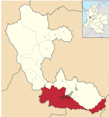
Ubicación geográfica, Pereira - Risaralda

Es llamada la “ciudad sin puertas” por la amabilidad y acogida con la que los pereiranos reciben a sus visitantes, territorio de hombres y mujeres pujantes que han convertido en una ciudad cívica y emprendedora. La pluriculturalidad de la población, sus fortalezas comerciales, sus áreas naturales y de patrimonio cultural hace uno de los mejores destinos del Paisaje Cultural Cafetero, lo que le confiere un especial atractivo para sus visitantes.