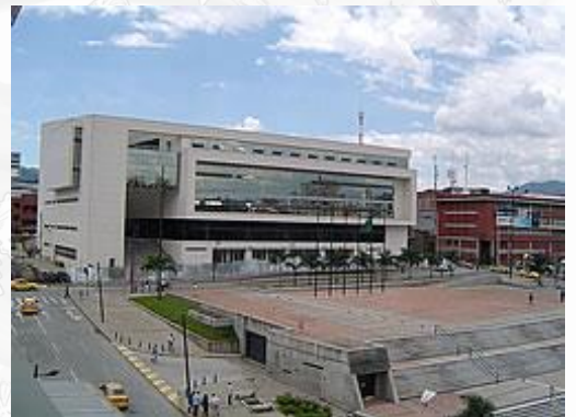
Plaza cívica Ciudad Victoria