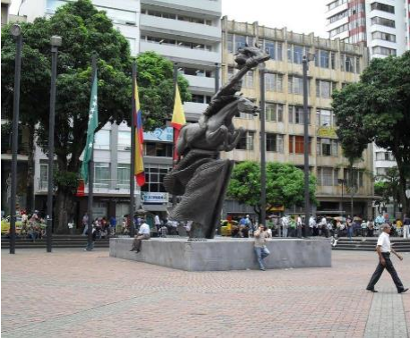
Plaza de Bolívar